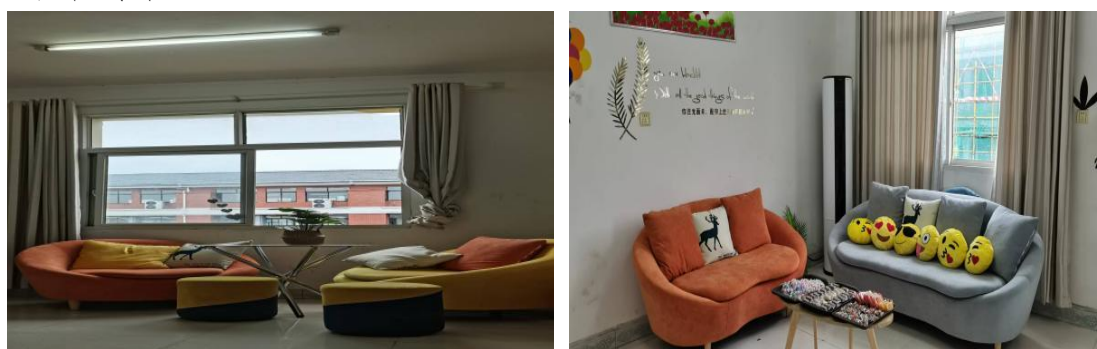
图十四：学校心理咨询室

长，其他班子成员为副组长，各科室负责人为成员的学生心理健康工作领导小组，制定了《溆浦县职业中等专业学校心理健康教育工作制度》《溆浦县职业中等专业学校心理健康辅导室建设方案》《溆浦县职业中等专业学校创建省级心理健康特色校工作方案》等一系列制度。二是加大硬件投入。2017年9月学校建立了心理健康辅导室（涓涓阳光室），设有心理健康办公室、心理咨询室、宣泄室、沙盘室、团体活动室，共200平方米，总投入100多万元。学校每年配套专项经费，用于购买心理健康教育书籍及心理健康教师队伍培训。2024年我校将与北京心领教育科技有限公司合作并引进“心理健康教育大数据平台”，就学生的背景调查、心理测评、减压放松、危机评估与预测、心理渲泄等多维度进行量化细化数字数据化管理。三是加强师资配备。学校现在专职心理教师4人，其中2人取得二级心理咨询师资格证，2人取得国家三级心理咨询师资格证，3人考取高级心理健康咨询师，3人考取高级家庭教育指导师；兼职心理辅导老师6人。心理健康教育纳入学校的课时管理。