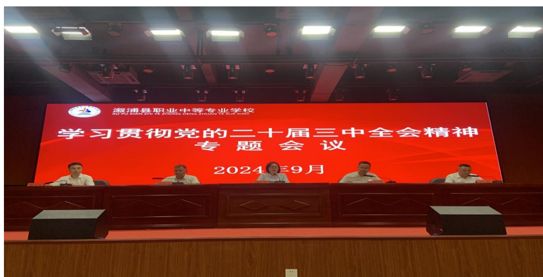
图一：学习贯彻党的二十届三中全会精神

1. 以新思想凝心铸魂，做到心中有理想、脚下有方向。学校党委坚持抓党建先抓政治，抓人才先抓思想的工作理念，抓实思想政治教育，以更强党性凝心铸魂。结合主题教育、主题党日、“三会一课”、“第一议题”，深入学习贯彻习近平新时代中国特色社会主义思想，及时跟进学习习近平总书记关于教育特别是职业教育的重要讲话和指示批示精神，将育人元素融于教育教学各个环节，积极开发课程思政项目，一体推进学生思想道德和职业道德培育。