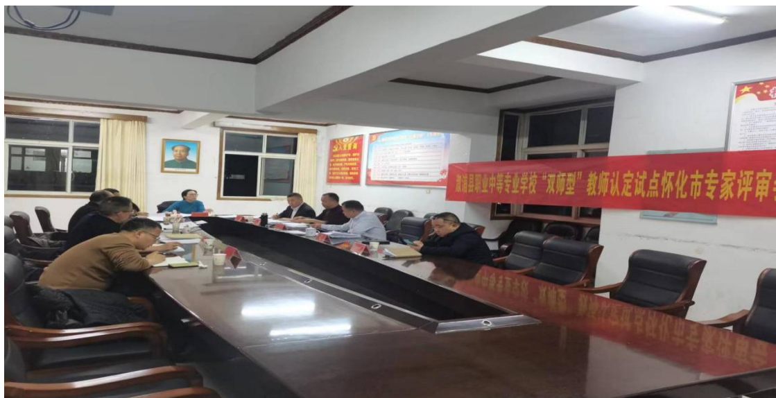
图十三：学校召开“双师型”教师认定推动会议