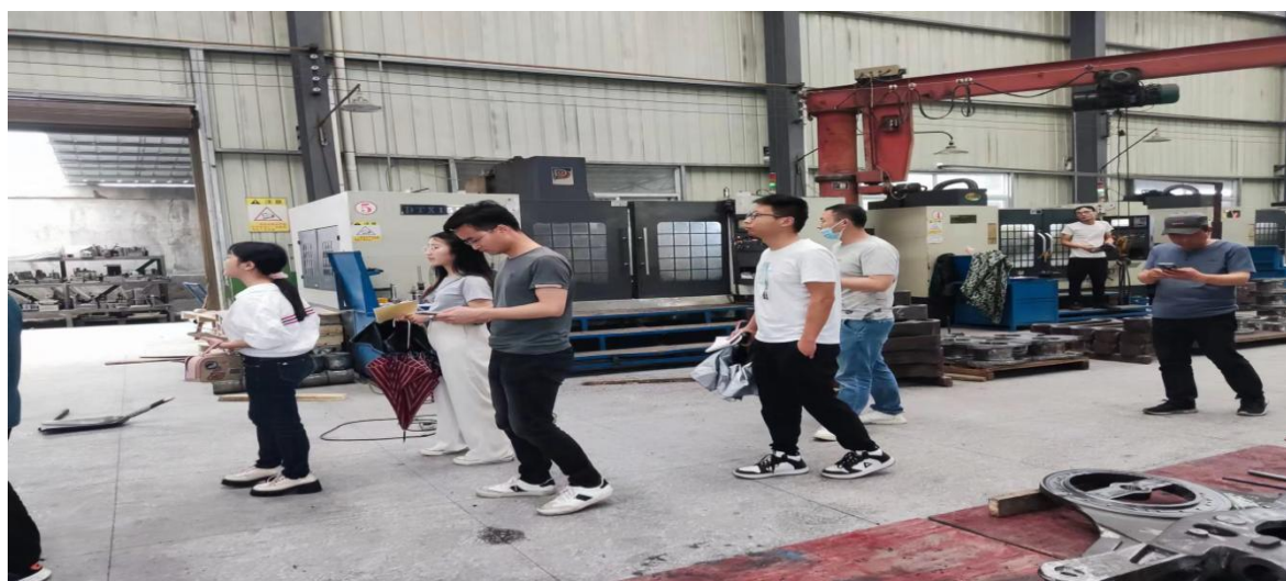
图十：机电、电子专业入企业实践，助力本地传统企业转型

2. 助推区域产业发展与转型升级。 我县产业加速发展和转型升级，对高素质技术技能人才的需求倍增。学校抢抓发展机遇，发挥溆浦职业教育办学条件优、专业技能强、管理模式好等优势，创新发展，打造符合我县实际的楚怡职教品牌，从关键环节加强调研，持续发力，找准专业定位，逐步压缩专业数量，用心办好2—3个专业群，有效化县域产业对高素质技术技能人才的供需矛盾。