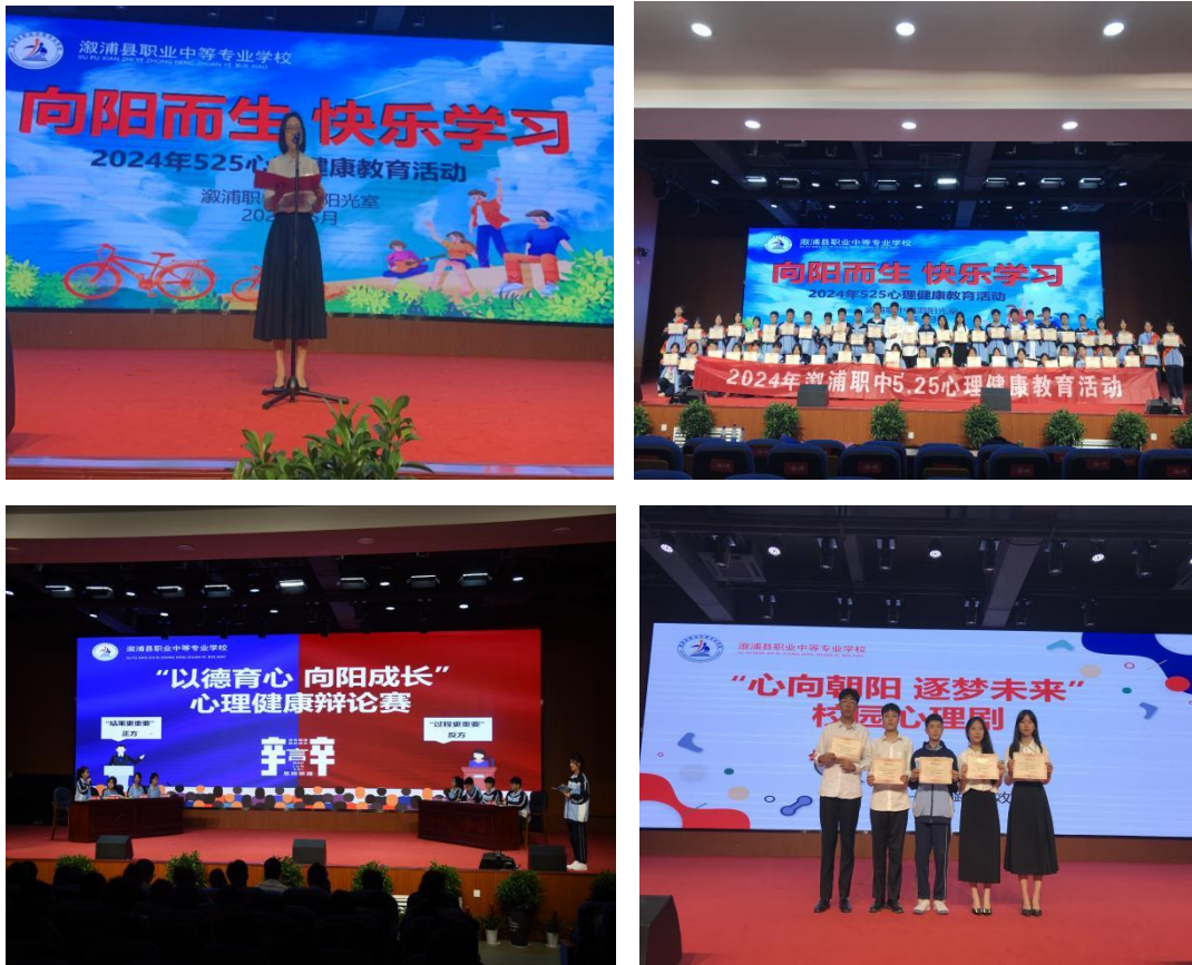
图十五：开展心理健康活动

康主题班会的形式面向全班作团体辅导。三是根据各年级学生的年龄特点、心理特征制定了完整的心理健康教学计划，比如高一新生入学新环境的适应；高二突破自我设限；高三缓解压力，轻松迎考或就业等。