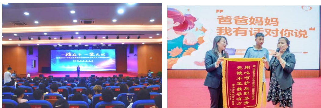
图十六：开展心理讲座

4. 家校互动力度明显。 每学期，学校以年级为单位集中开展2—3次家庭心理健康教育讲座，让学生家长了解、把握学生生理、心理发展的机制与特点，掌握心理健康教育的有效方法与途径，注重自身良好心理素质的培养，营造家庭心理健康教育的环境，提高家庭教育的质量。每年新生入校后，学校会与家长一起，共同完成学生心理档案的建立。