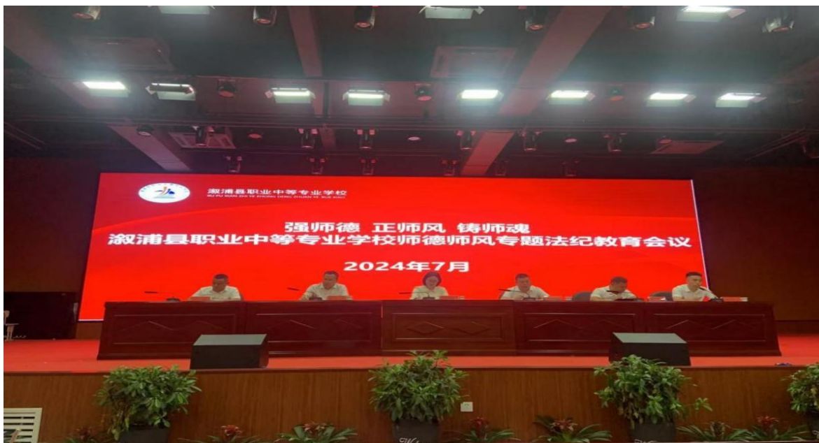
图四：师德师风专题培训

监督、考核机制，推进师德师风全链条闭环管理机制。开展“强师德 正师风 铸师魂”师德师风专项活动，提振教工精气神。加强党纪学习教育，严肃处理违规违纪行为，对苗头倾向性问题抓早抓小抓实。