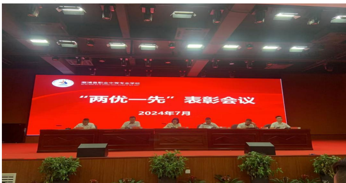
图三：“两优一先”表彰大会

动、“三会一课”制度进一步细化规范，严肃规范专题组织生活会，用心开展谈心谈话，认真批评与自我批评。今年以来，组织开展支部党员大会9次，支委会12次，上专题党课6次，12次“一月一片一课一实践”主题党日活动，其中开展“两优一先”表彰大会活动，通过表彰大会，树立典型，弘扬正气，激发全体成员的荣誉感和责任感，进一步增强党组织的凝聚力和战斗力。今年共培养了3名积极分子加入党组织，并按期转预备党员2名。加强对党员的教育、管理、监督和服务，充分发挥“战斗堡垒”和党员先锋模范作用。