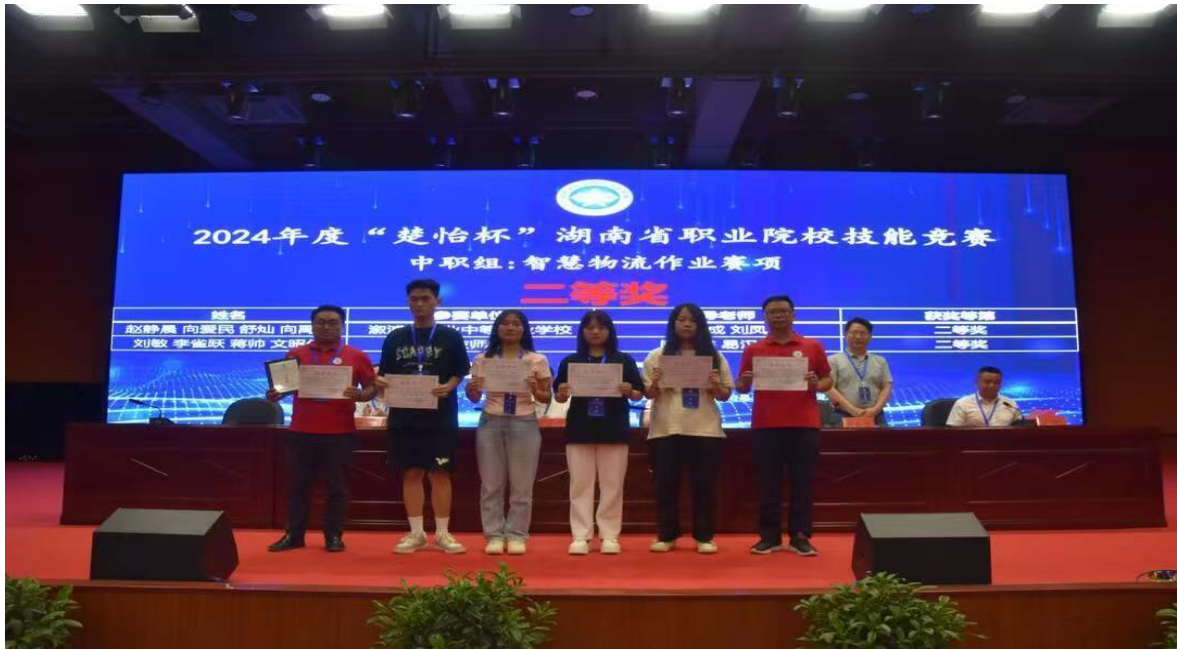
图十二：学校获湖南省智慧物流技能大赛二等奖