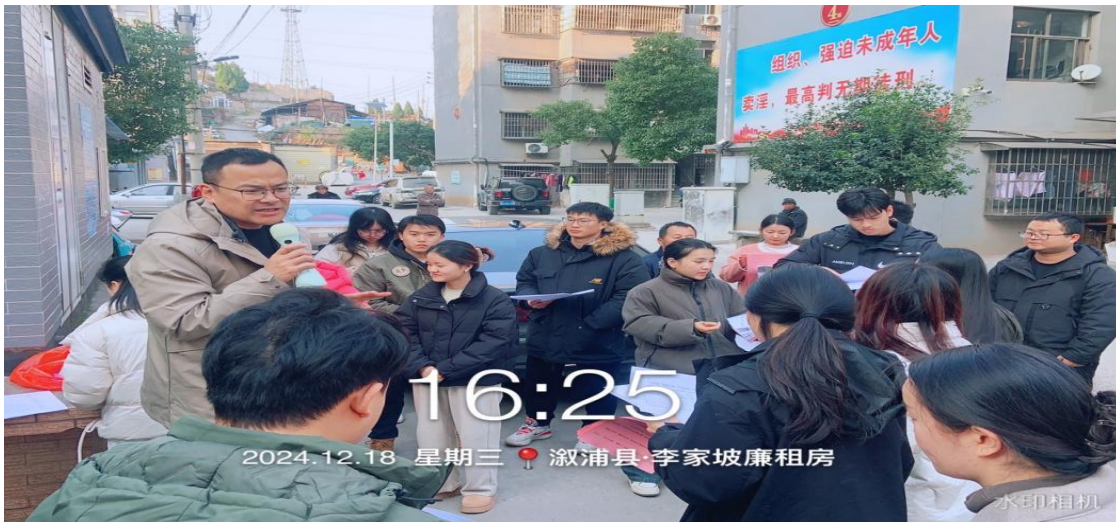
图十一：社区“敲门行动”