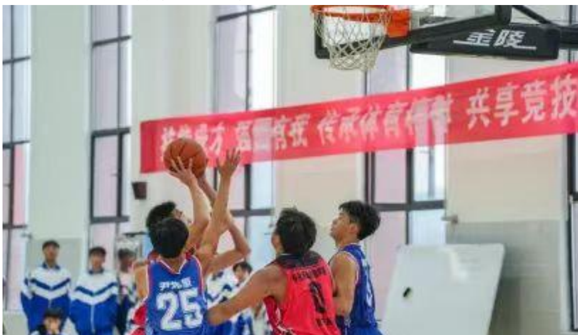
图五：篮球社团组织学校篮球赛

2. 五育并举，促进学生全面发展。 学校践行五育并举的教育理念，在思政教育的基础上，协同发力智育、体育、美育、劳动教育等方面。在智育方面，学校紧密结合思政教育，培养学生的创新思维与实践能力。通过学科竞赛、科研项目等活动，激发学生的学习兴趣 and 创造力，提高综合素质。体育方面，学校重视学生的身体素质培养，开展丰富的体育活动，如运动会、体育社团活动等，锻炼身体，增强体质。体育课程也注重培养团队合作精神和竞争意识。美育方面，学校通过校园文化活动、艺术课程等途径，提升审美素养。举办文化艺术节、艺术展览等，为学生提供展示才艺的平台，培养艺术修养和审美情趣。劳动教育方面，学校组织学生参与职业体验和社会实践活动，培养劳动技能与习惯，树立正确劳动观念，体会劳动的价值和意义。各育相互渗透、促进，共同推动学生全面成长。