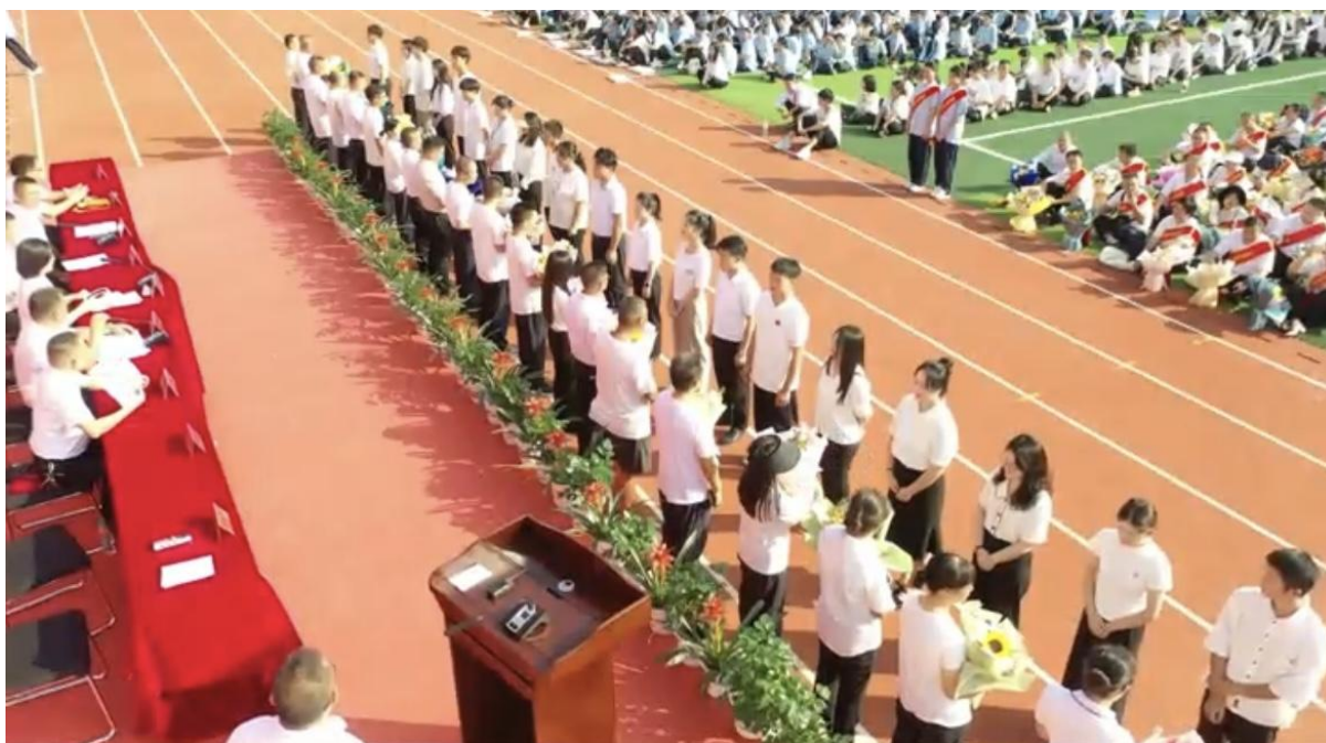
图八：举行“青蓝工程”师徒结对仪式