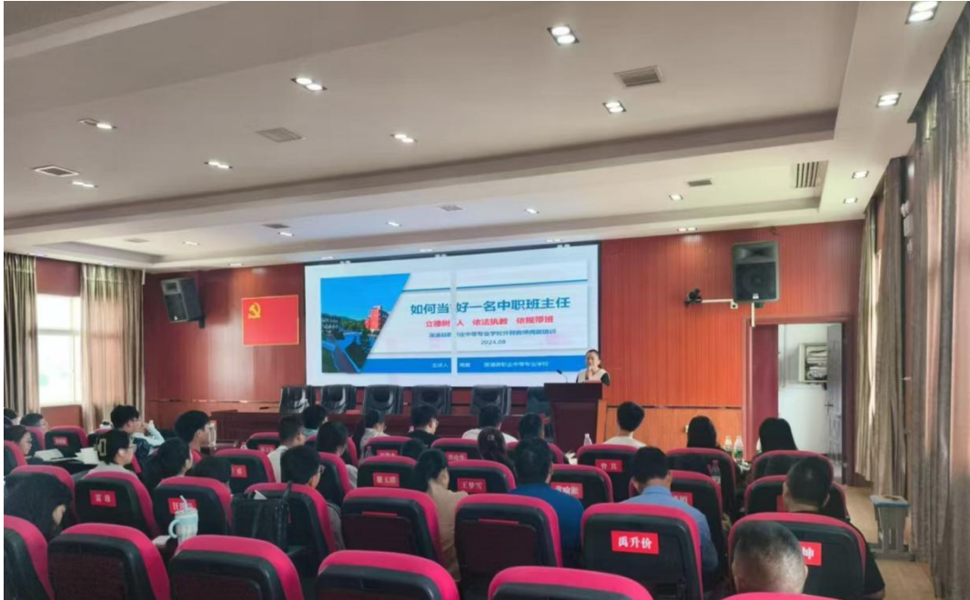
图六：班级文化建设培训

享与传递，确保管理经验能够在不同班级中得到推广和落实。这些举措不仅提升了班级管理的水平，更在无形中培养了学生的集体荣誉感和责任感。